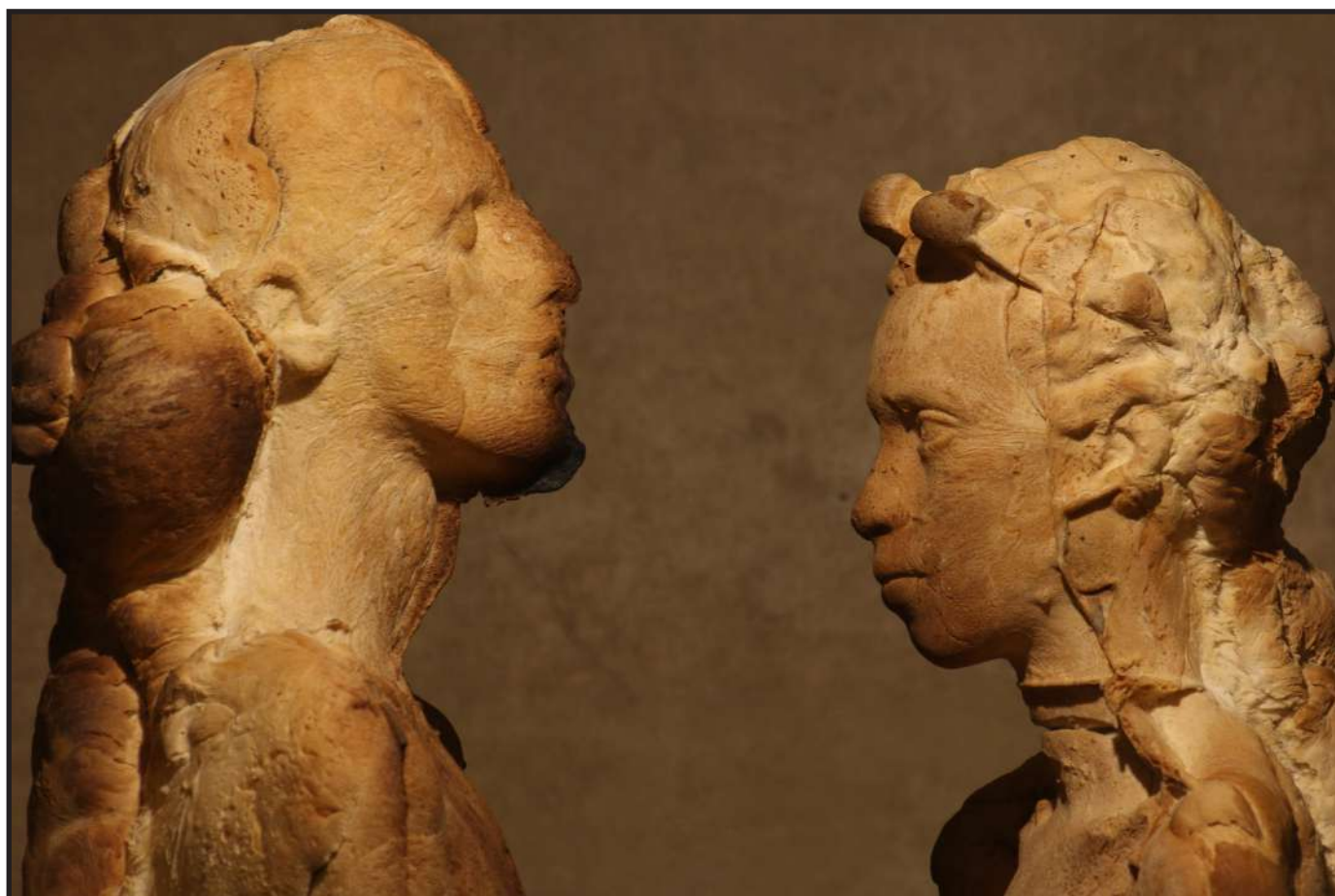
MATTEO LUCCA, SILENT DIALOG, 2018 pane

Matteo Lucca utilizza il pane come materia prima per le sue sculture. All'interno di stampi di terracotta prendono forma statue di pane, dove il lavoro dell'artista entra in relazione con le infinite variabili date dal processo di lievitazione e cottura che, ogni volta, crea opere sempre nuove, per riflettere sul pane come elemento vitale e sul dono.